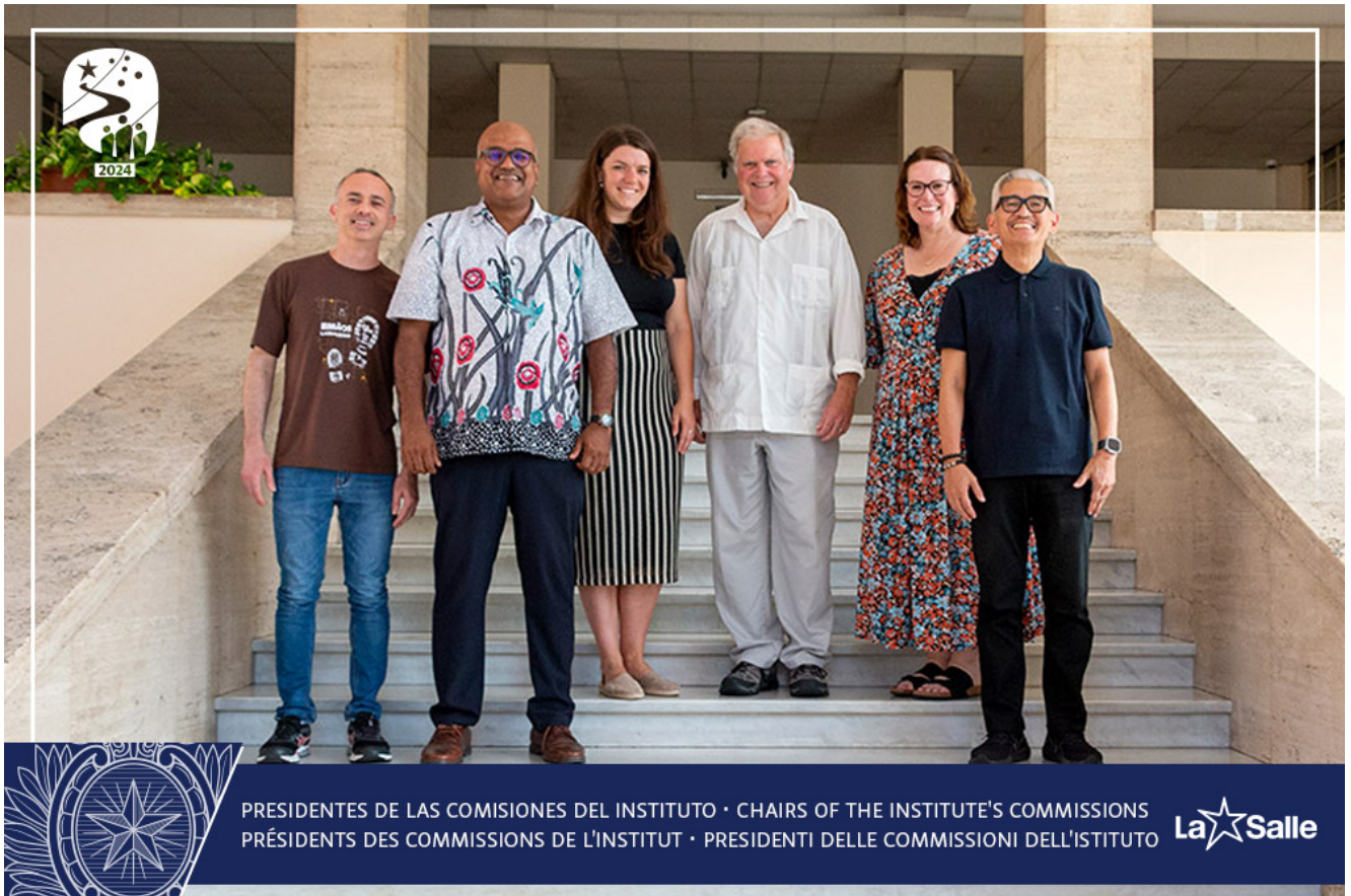
PRESIDENTES DE LAS COMISIONES DEL INSTITUTO · CHAIRS OF THE INSTITUTE'S COMMISSIONS PRÉSIDENTS DES COMMISSIONS DE L'INSTITUT · PRESIDENTI DELLE COMMISSIONI DELL'ISTITUTO