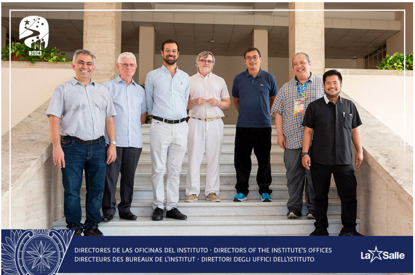
DIRECTORES DE LAS OFICINAS DEL INSTITUTO · DIRECTORS OF THE INSTITUTE'S OFFICES DIRECTEURS DES BUREAUX DE L'INSTITUT · DIRETTORI DEGLI UFFICI DELL'ISTITUTO