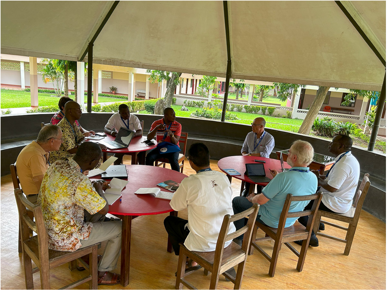
Loading the next set of gallery items... Cargar más