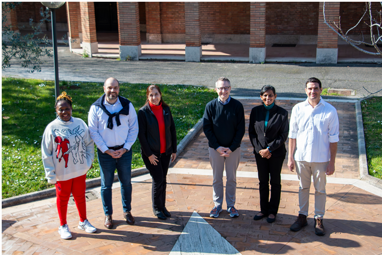
Consejo Internacional de Asociación y Misión Educativa Lasaliana (CIAMEL)