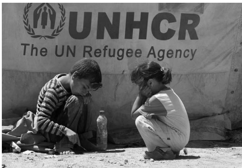
Los niños de Siria refugiados

Pienso en los niños de Siria refugiados en países vecinos, cuyo número como han asegurado los principales organismos humanitarios de la ONU llega ya a un millón, sin olvidar los 7.000 niños que han muerto durante el conflicto armado. Y al comentar lo anterior, el director ejecutivo de UNICEF, Anthony Lake, decía: No es sólo otro número. Son niños arrancados de sus casas, quizás incluso de sus familias, enfrentados a horrores que sólo ahora empezamos a comprender. No es fácil imaginar el daño físico, el miedo, los traumas y los sufrimientos experimentados por estos niños y los peligros que los acechan como el trabajo infantil, los matrimonios forzados, el tráfico de órganos y la explotación sexual.