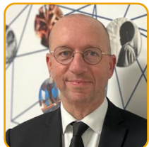
Hervé Lecomte Secretario General OIEC

En el mensaje que dirigimos el año pasado a la Conferencia de Brno (Chequia) “La aldea educativa global desde la unión de las aldeas locales” decíamos: “Tendrás que encontrar la forma original de construir la aldea educativa local, sin copiar o estandarizar su contribución. Basándoos en vuestra cultura, tradición, arte, valores, historia, etc. descubriréis vuestra “llama azul”, que es vuestra forma creativa y única de ser educadores constructores del pueblo local según lo que Dios espera de vosotros. Entonces la aldea educativa global no será una homogeneización o uniformización de todas las culturas (como el nuevo colonialismo mental) sino la unión de muchas aldeas locales en la riqueza de su diversidad”.