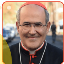
S.E. Cardinal José Tolentino de Mendonça

Prefecto del Dicasterio de la Cultura y Educación