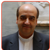
P. Pedro Aguado Presidente de la Comisión de Educación de las UISG-USG

Somos conscientes de la gran dificultad y complejidad que conlleva construir un pacto por la educación movilizándolo a todos los agentes y sectores educativos y sociales de la ciudad, pero urge hacerlo. No debemos abrumarnos ni desfallecer ante esta tarea. Todo lo contrario, os invito a tomar la iniciativa, a abrir las puertas de vuestras escuelas y salir al encuentro de los otros. Primero les propongo impulsar y propiciar la participación de vuestras Comunidades Educativas; luego abriros a colaborar y trabajar juntos con otras escuelas o instituciones educativas (católicas o no, públicas o privadas); en tercer lugar, con la municipalidad, con los diversos colectivos sociales. Urge construir un nuevo “nosotros”, necesitamos “proyectos comunes” que nos permitan alumbrar una sociedad más fraterna y solidaria, un mundo más humano, afable, acogedor, en el que nos cuidemos unos a otros y a la casa que habitamos.